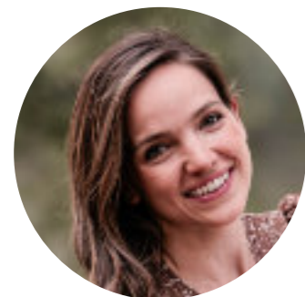
Kenzie, 34, Mutter von drei kleinen Kindern

„Durch TPM habe ich gelernt, dass ein großer Teil meiner Lebenserfahrungen mit meinen eigenen Wahrnehmungen der Realität zu tun hat, die oft nicht ganz der Wahrheit entsprechen und mich gefangen halten. Ich sehe unangenehme Emotionen und Situationen in meinem täglichen Leben und in Beziehungen als Gelegenheiten, mit dem Heiligen Geist zu kooperieren. Durch TPM kenne ich einen Weg, wie ich, so wie ich bin, vor Gott kommen kann, damit Er mir Seine wahre Perspektive zeigt und mich befreit.“